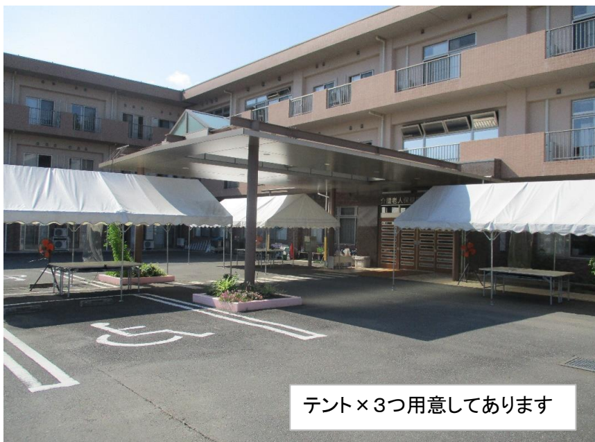
テント×3つ用意してあります