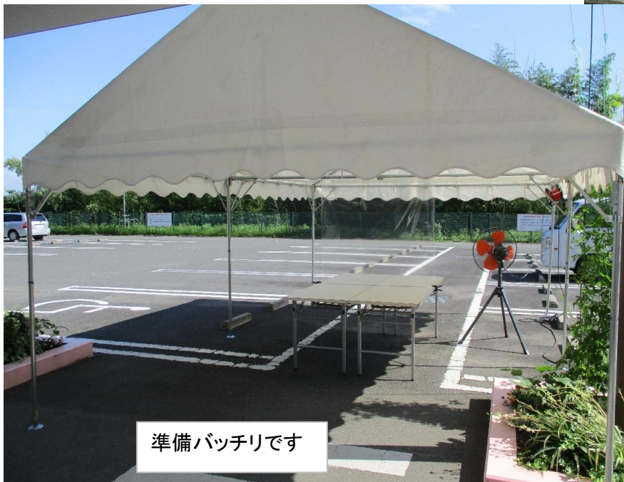
準備バッチリです