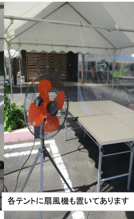
各テントに扇風機も置いてあります