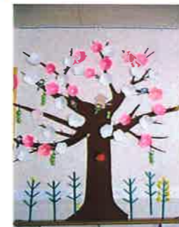
みなさんと☆☆ 作った梅の花