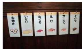
屋台のお寿司屋さん！次は何を握りましょう