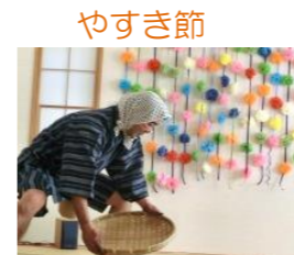
憧れのハワイ航路