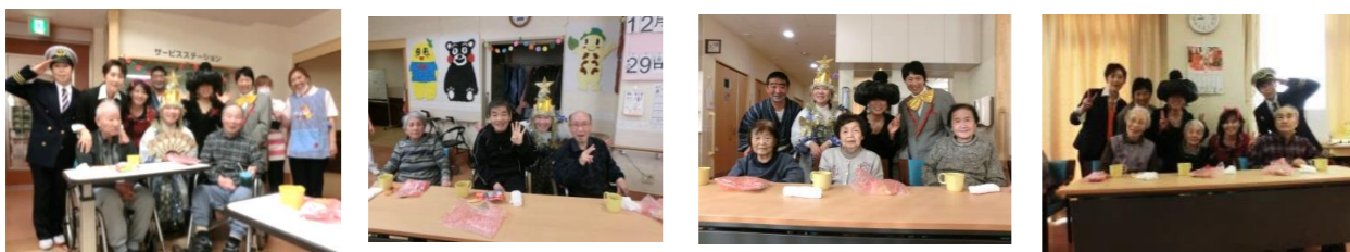
職員とハイチーズ！(〜)!