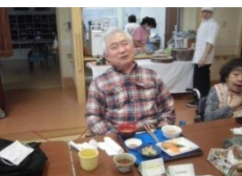
お腹いっぱいになりました