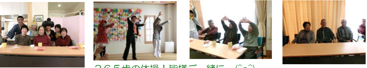
365歩の体操！皆様一緒に (〜)!