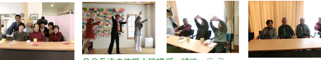
365歩の体操！皆様一緒に (^o^)