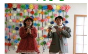
吉永小百合&橋幸夫