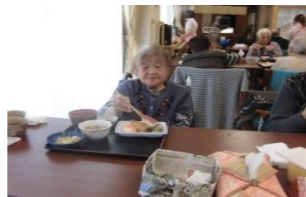
美味しく頂きました