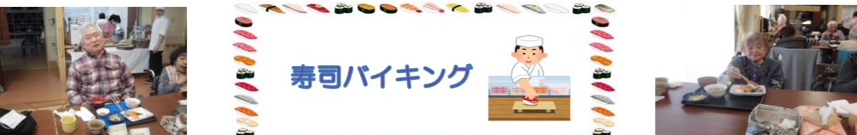
お腹いっぱいになりました