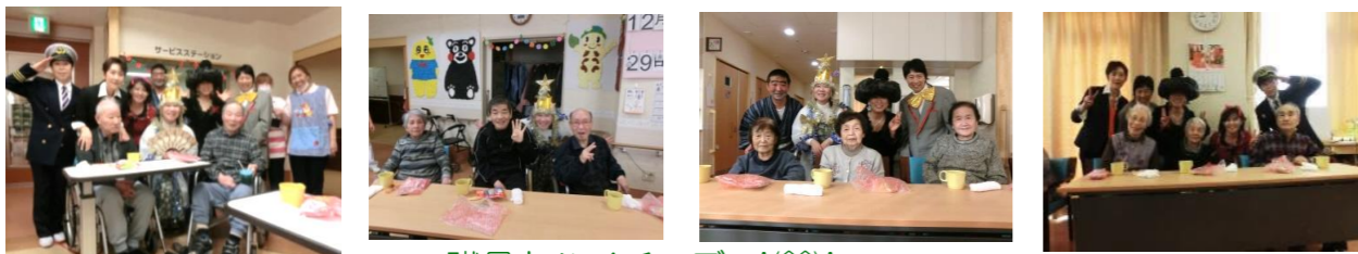
職員とハイチーズ！(〜)!