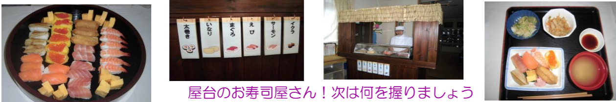
屋台のお寿司屋さん！次は何を握りましょう