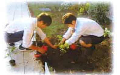
ガーデンブラザーズ