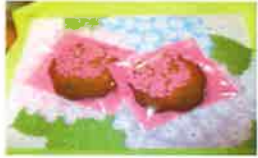
記念の さくらサブレ

6月1日で日の出さくらは5周年を迎えました。日頃よりデイケアをご利用頂き、心より感謝致します。ご利用者様には「さくらは楽しい所♪リハビリをすると力が出てくる♪」ご家族様から「さくらに通えている事で安心。」との思いを持ち続けて頂けるよう、これかれも職員一同、頑張っまいます。どうぞ宜しくお願い致します。5月は《選べる楽しさ》を感じて頂ける催しや野菜の苗植えを行いました。外気浴でリフレッシュされている様子もご覧ください。