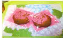
記念の さくらサブレ

6月1日で日の出さくらは5周年を迎えました。日頃よりデイケアをご利用頂き、心より感謝致します。ご利用者様には「さくらは楽しい所♪リハビリをすると力が出てくる♪」ご家族様から「さくらに通えている事で安心。」との思いを持ち続けて頂けるよう、これかれも職員一同、頑張っまいます。どうぞ宜しくお願い致します。5月は《選べる楽しさ》を感じて頂ける催しや野菜の苗植えを行いました。外気浴でリフレッシュされている様子もご覧ください。