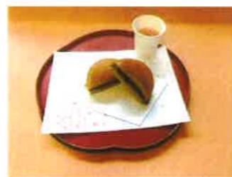
抹茶どら焼き 桜茶