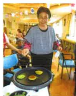
ふっくらしてきたら裏返し