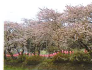
日の出町グランド