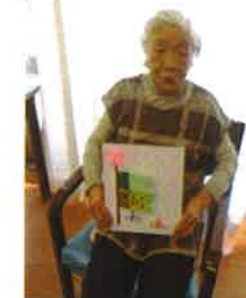
可愛らしい作品 の出来上がり