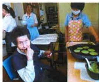
😊 おやつ作りはとっても楽しい 🍵