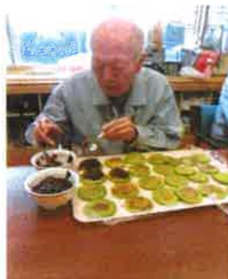
あんこをのせる担当です