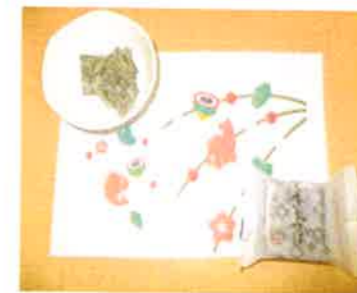
きんつばと酢昆布