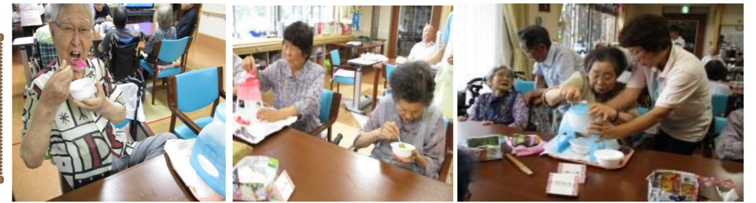
イチゴ・メロン・レモンの味は3種類