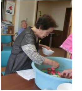
お土産ができました