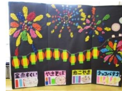
夏祭り 皆さんとの共同作業品