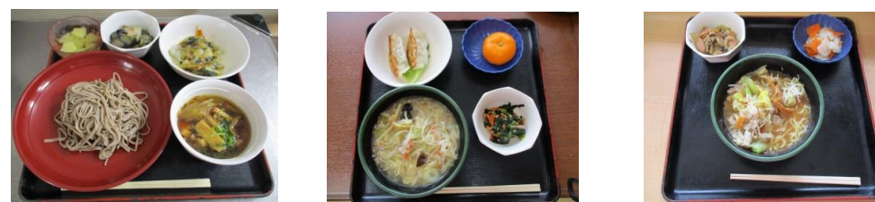
とり南蛮つけそば