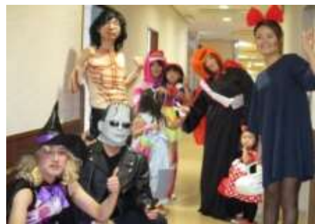
可愛いちびっ子からチョコの贈り物!