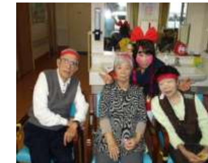
皆さんハイチーズ