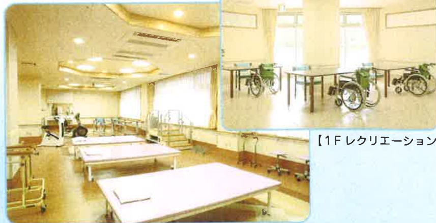
【1F リハビリテーション】