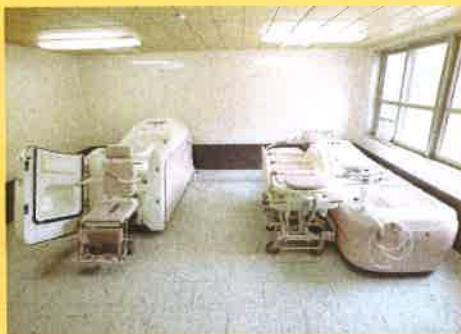
【2F・3F 車椅子浴槽/特殊浴槽】