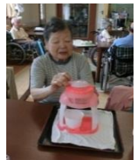
一生懸命にかいてます