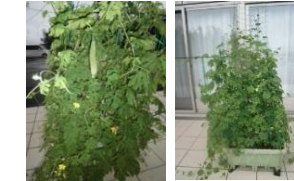
ゴウヤで小さな緑のカーテン