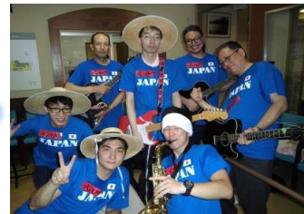
男性職員で結成しています