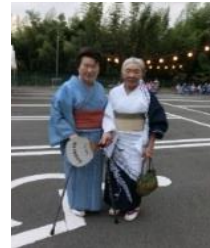
2年続けて踊りました♡