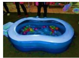
ちびっ子に大人気 ヨーヨー釣り