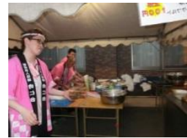
焼き鳥・焼きそば・ フランクフルト美味しいよ