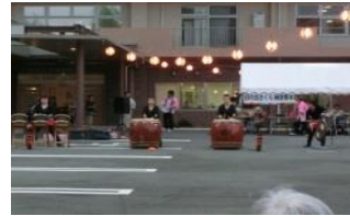
太鼓演奏・鼓打魔会の皆様