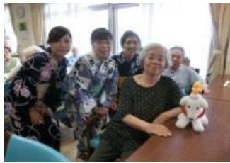
浴衣姿の職員とハイチーズ