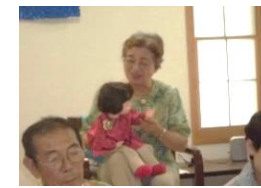
私千カちゃん 昔むか～しのおどぎ話