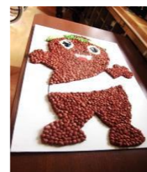
協力して行います。

おはながみを丸 めて貼り、皆で 力を合わせて作 りました。 今月はあきる野 市のシンボル もりっこさん ちゃん♡を作り