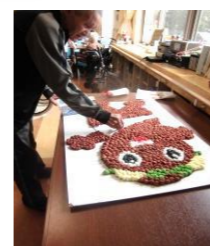
形が出来上がってきました。