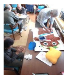
完成まであと少し。