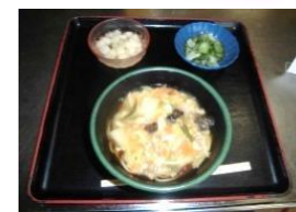
野菜あんかけラーメン