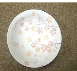
記念品として さくら模様のお皿