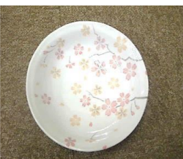
記念品として さくら模様のお皿