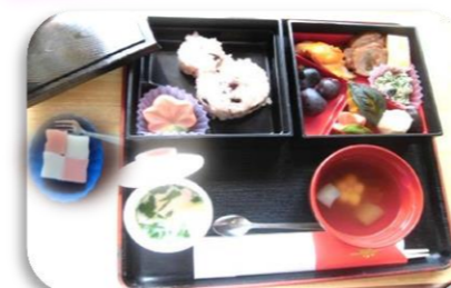
お赤飯・すまし汁・茶碗蒸し・紅白ようかん