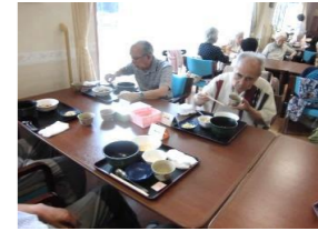
栄養のバランス良く とても美味しいですヨ。来て良かった～。