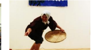
ドジョウをすくってます。