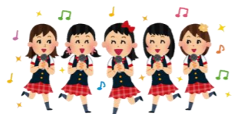
千 昌夫とさくらダンサーズ