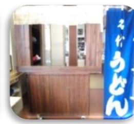
お馴染の屋台です