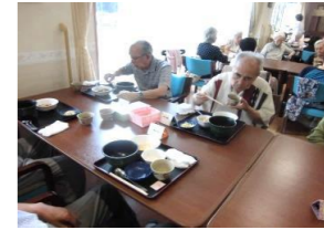
栄養のバランス良く とても美味しいですヨ。来て良かった～。