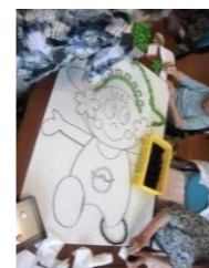
皆で協力して行います

おはながみを丸めて貼り、皆で力を合わせて作りました。今月は日の出町のシンボル ひのでちゃん