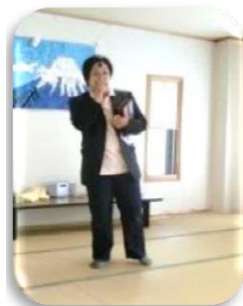
千 昌夫?の北国の春